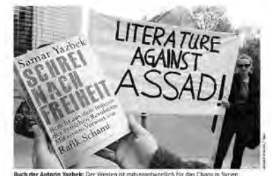
Buch der Autorin Yazbek: Der Westen ist mitverantwortlich für das Chaos in Syrien.

Es dürfte für die Europäer- jedemfalls für die älteren unter ihnen - ein wenig sa- tirenhaft sein. Die Bilder sind ja dieselben, auch wenn sie heute in 140 und Farbe ausgeteilt werden in die Wohn- zimmer und nicht in Schwarz-Weiß in Lichtspielhäusern gezeigt werden. Es sind die Aufnahmen aus den Jahren nach dem zweiten Weltkrieg, Bilder von Flucht und Vertriebung, Schreckliche- bilder.