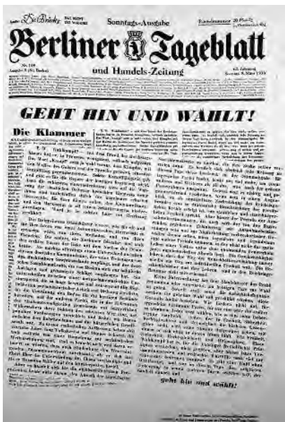
Klare Botschaft auf Seite Eins im März 1933.