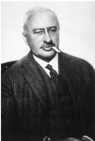
Theodor Wolff porträtiert von Lotte Jacobi, einer berühmten Fotografin der Weimarer Republik.

Kattune, die damals bei den Berlinerinnen sehr beliebt waren.« Er hatte drei Geschwister. Nach einem kurzen, lediglich mit der Mittleren Reife abgeschlossenen Gymnasialbesuch – »ich hatte mit der deutschen Sprache bei den Magistern kein Glück« – begann er, der Journalist werden wollte, zuerst einmal eine kaufmännische Lehre beim Berliner Tageblatt (B.T.), einem der größten Publikationsorgane seines Cousins, des angesehenen Verlegers Rudolf Mosse. Dabei blieb es nicht lange, denn mit Reisefeuilletons, Theater- und Literaturberichten erregte er in Berlin schnell Aufmerksamkeit. Die Stadt weckte seinen literarischen Ehrgeiz erfolgreich, in wenigen Jahren wurde er mit mehreren Romanen,