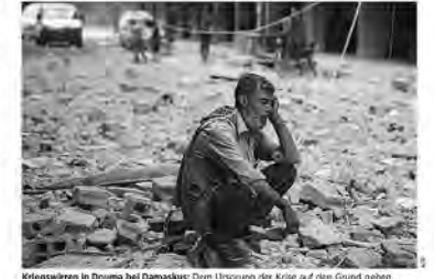
Kriegswägen in Douma bei Damaskus: Dem Ursprung der Krise auf den Grund gehen.

Auch heute gibt es wieder Flucht und Vertriebung in Europa. Und auch heute sind diese Bilder in den Medien überall präsent. Die Situation der Flüchtlinge ist ein Teil der europäi- schen Realität geworden, ein Teil der Realität jedes einzelnen Europäers. Nun müssen sie schnelle Lösungen fin- den - um die Krisen zu überwinden, die ja selbst nur die Konsequenz einer an- deren Realität ist.