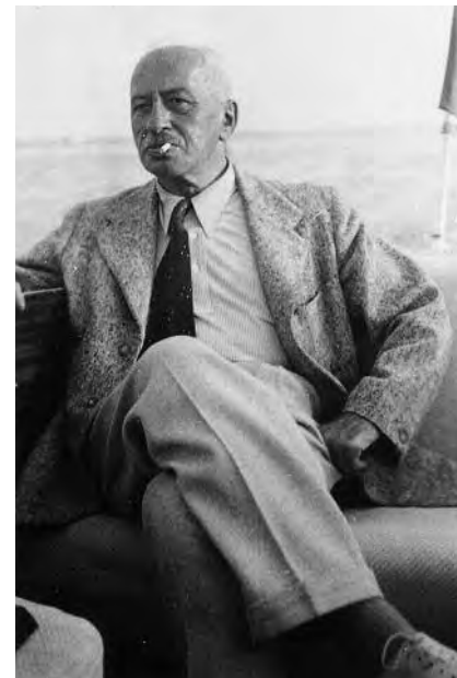
Blick in eine ungewisse Zukunft: Theodor Wolff im französischen Exil

In der Endphase der Weimarer Republik sah er die größte Gefahr für die Demokratie von den Nationalsozialisten ausgehen und empfahl deshalb zum Entsetzen seiner liberalen Parteifreunde öffentlich, in dieser Ausnahmesituation nicht die rechtsliberale Splitterpartei, die neu gegründete »Deutsche Staatspartei«, sondern die SPD zu wählen. Darin drückte sich kein politischer Kurswechsel aus, sondern lediglich politischer Pragmatismus. Die letzten Leitartikel beschworen wie zuvor nachdrücklich freiheitliche, politische Ideale und zeichneten ein düsteres Szenarium rechts-