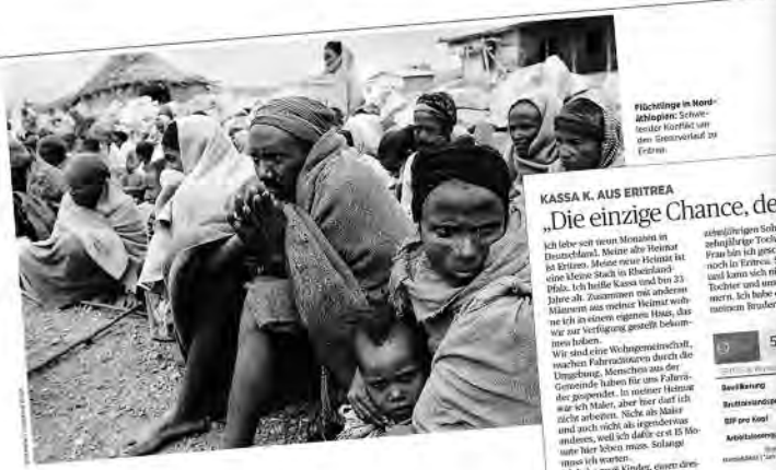
Flüchtlinge in Nordafrikanischer Schwarz-Koralle am Grenzübertritt in Italien

Armut, Krieg, Militärdienst: Es gibt viele Gründe, aus denen Menschen ihre Sachen packen und in ein neues Land gehen. Die Reisen sind oft lebensgefährlich. Sieben Flüchtlinge aus sieben Ländern erzählen, warum sie es dennoch gewagt haben.