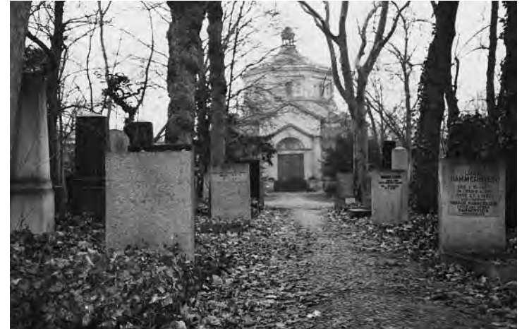
Von den Nazis in den Tod getrieben: Auf dem Jüdischen Friedhof in Berlin-Weißensee fand Theodor Wolff seine letzte Ruhestätte (vorne links).

Die autobiografischen Berichte über das Kaiserreich und die Weimarer Republik erschienen 1936 unter dem Titel »Der Marsch durch zwei Jahrzehnte« im Verlag Allert de Lange; im selben Jahr gab es eine englische und 1937 eine französische Übersetzung. An den publizistischen Fernkämpfen gegen den Nationalsozialismus beteiligte er sich prinzipiell nicht. Mit Erich Kästner teilte er die Meinung, ein Schneeball lasse sich aufhalten, nicht jedoch eine Lawine. In der Zeit der Demokratie und Freiheit hatte er seine politische und gesellschaftliche Aufgabe als politischer Mensch und Journalist gesehen. Ein autoritäres oder totalitäres Regime funktionierte nach Prinzipien, die sich auch auf die Presse verhängnisvoll auswirkten. In einer bislang unveröffentlichten Aufzeichnung aus dem Exil heißt es dazu: »In keinem autoritär geleiteten Lande kann die Presse handelnde Person sein, immer ist sie nur der begleitende Chor. Und auch nicht der antike Chor, der Chor des Ödipus, der nach freiem Ermessen lobsingend oder beschwörend seine Stimme erhob. Das gehört zu den Lebensnotwendigkeiten des Systems, der autoritäre Staat könnte nicht anders bestehen. Aber eine Abweichung vom ursprünglichen Prinzip ist es, wenn unter dem bolsche-